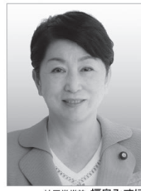
社民党党首 福島みずほ