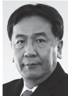
立憲民主党 代表 枝野幸男